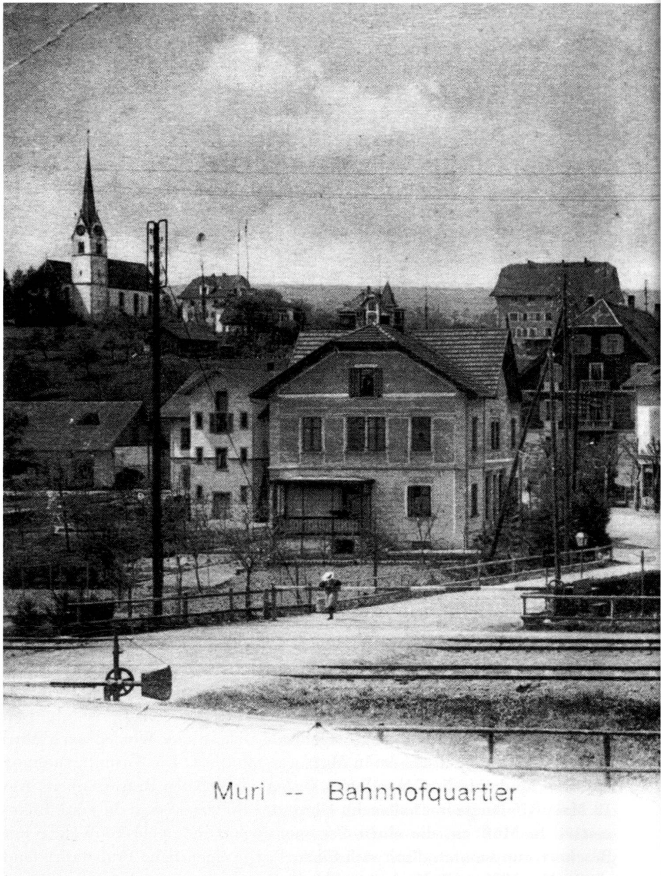
Muri -- Bahnhofquartier