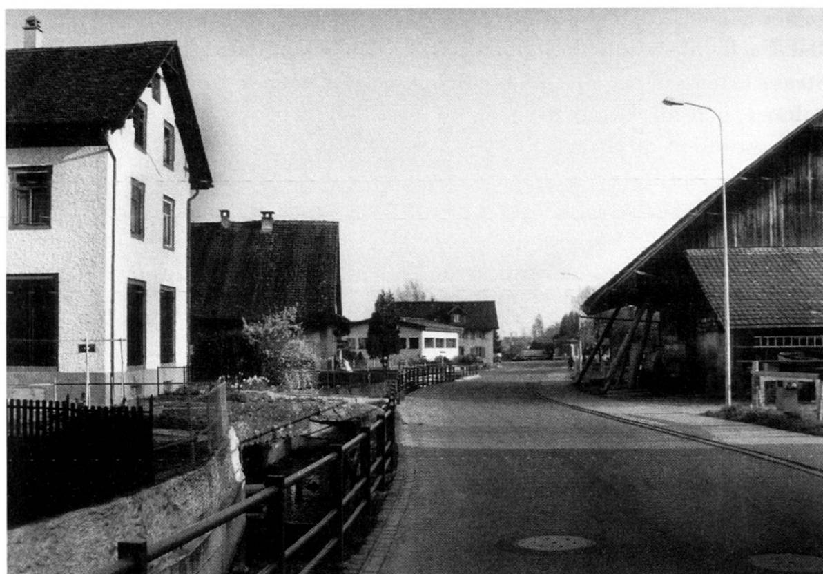
Gleiche Ansicht heute