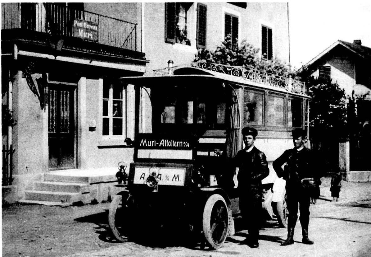
Postautoverkehr Muri-Affoltern a. A. 1906. Orion-Omnibus vor der alten Post an der Marktstrasse

Güterverkehr 2174.85 Fr. Diesen Beträgen standen Ausgaben von 20 531.90 Fr. entgegen, was zu einem Defizit von 7030.70 führte. Somit konnte für das erste Halbjahr keine Abschreibung vorgenommen und auch keine Dividende ausbezahlt werden. Betriebschef Steinmann schrieb dazu: «Das Winterhalbjahr wird punkto Frequenz an Einnahmen bedeutend kleiner, die Betriebsausgaben eher bedeutend grösser. Die Existenz unseres Verkehrs ist in Frage gestellt, um so mehr als die Preise für Benzin sehr gestiegen sind.» Für die nächsten sechs Monate rechnete man mit einem Defizit von 13 000 Fr. Das veranlasste die Gesellschaft, den Betrieb nach 9½ Monaten, am 15. Januar 1907, einzustellen. Die Gemeinde Muri hatte nach Vertrag 376 Fr. Garantie zu leisten 55 .