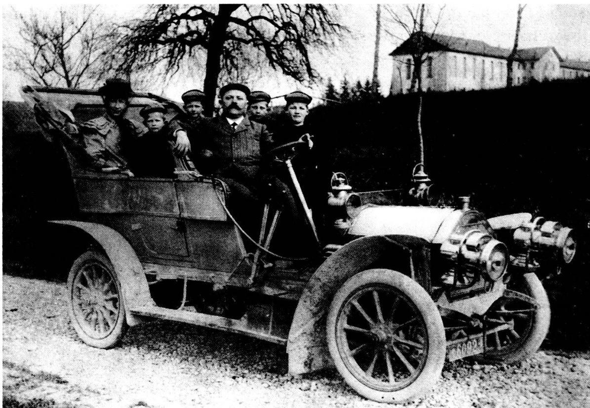
Das erste Auto in Muri. Besitzer Louis Wild

Die ersten Strassenstücke wurden 1924 geteert. Im September teilte Kreisingenieur Meier dem Gemeinderat mit, dass nächstens mit der Teerung der «Landstrasse ausserorts», d. h. von der ehemaligen Mosterei Gut bis zur Seilere Schärer begonnen werde. Zugleich fragte er den Gemeinderat an, ob er nicht auch mit der Teerung vom Haus Stöckli-Gehrer (heute Haupt- eingang des Pflegeheims) bis zur Mosterei Gut einverstanden sei, man müsse mit einem Betrag von 50 Rp. pro m 2 rechnen, im ganzen 120 Fr. Für die zweite und dritte Teerung in den folgenden beiden Jahren müssten noch 30