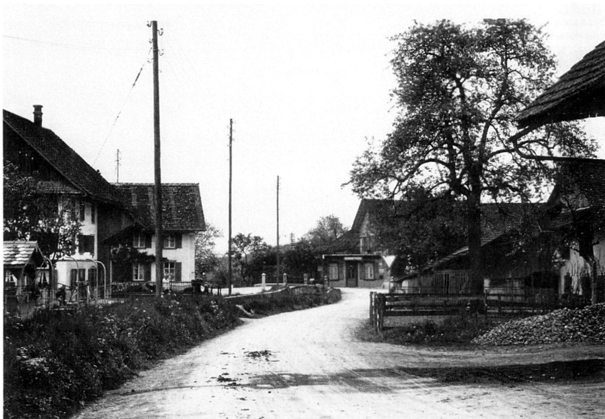
Bachstrasse in Dorfuri mit Blick gegen das Restaurant Frohsinn