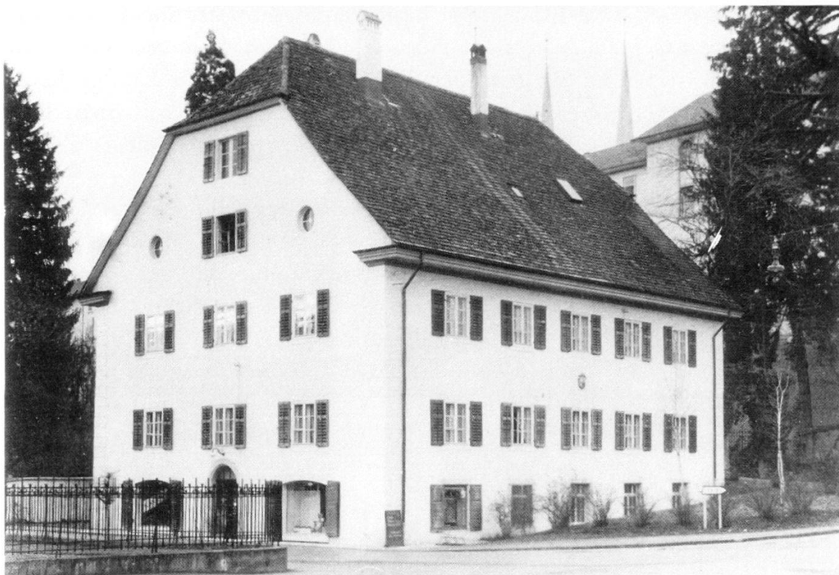
Haus der Strohfirma Stöckli-Gehrer, 1937 dem Aarg. Kranken- und Pflegeheim verkauft