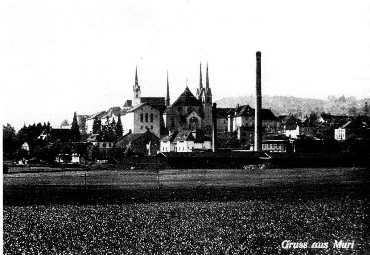
Ziegel- und Backsteinfabrik mit den beiden Hochkaminen. Heute als Lager verwendet