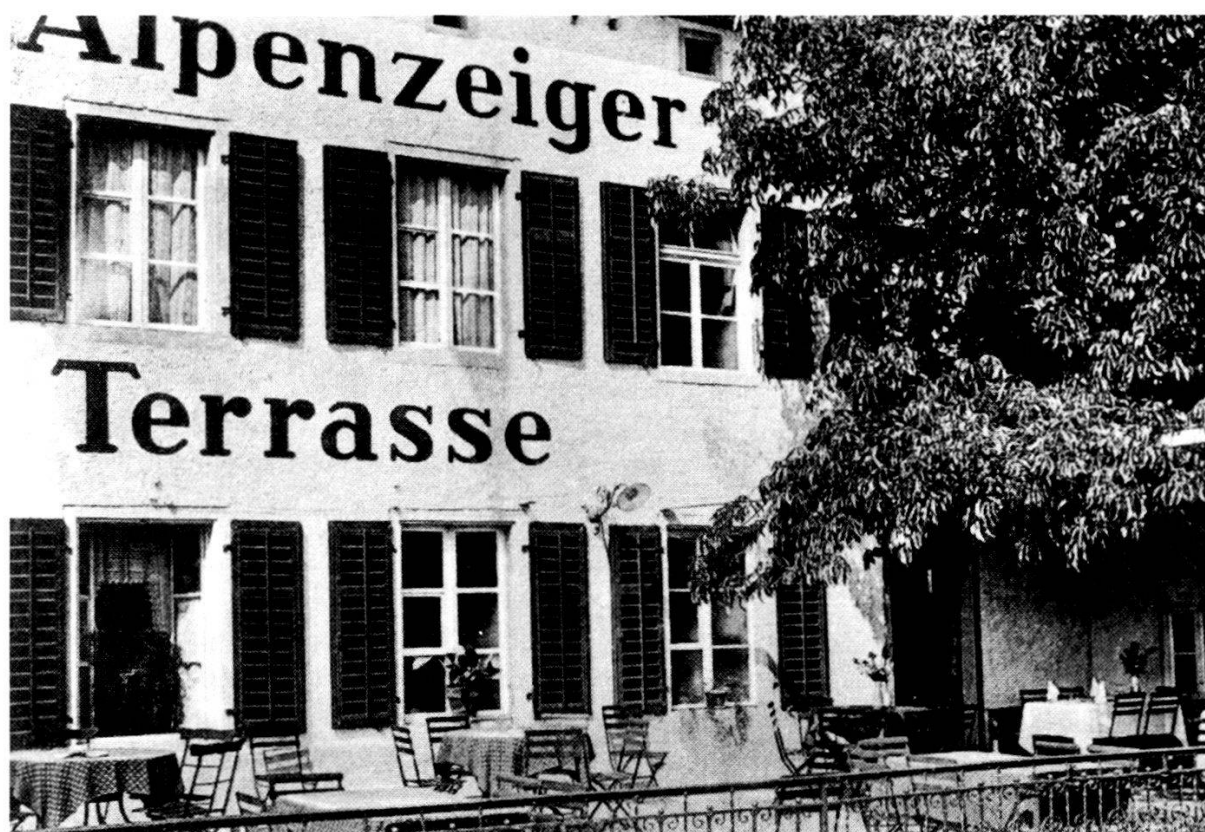
Terrasse des Restaurants Alpenzeiger um 1920