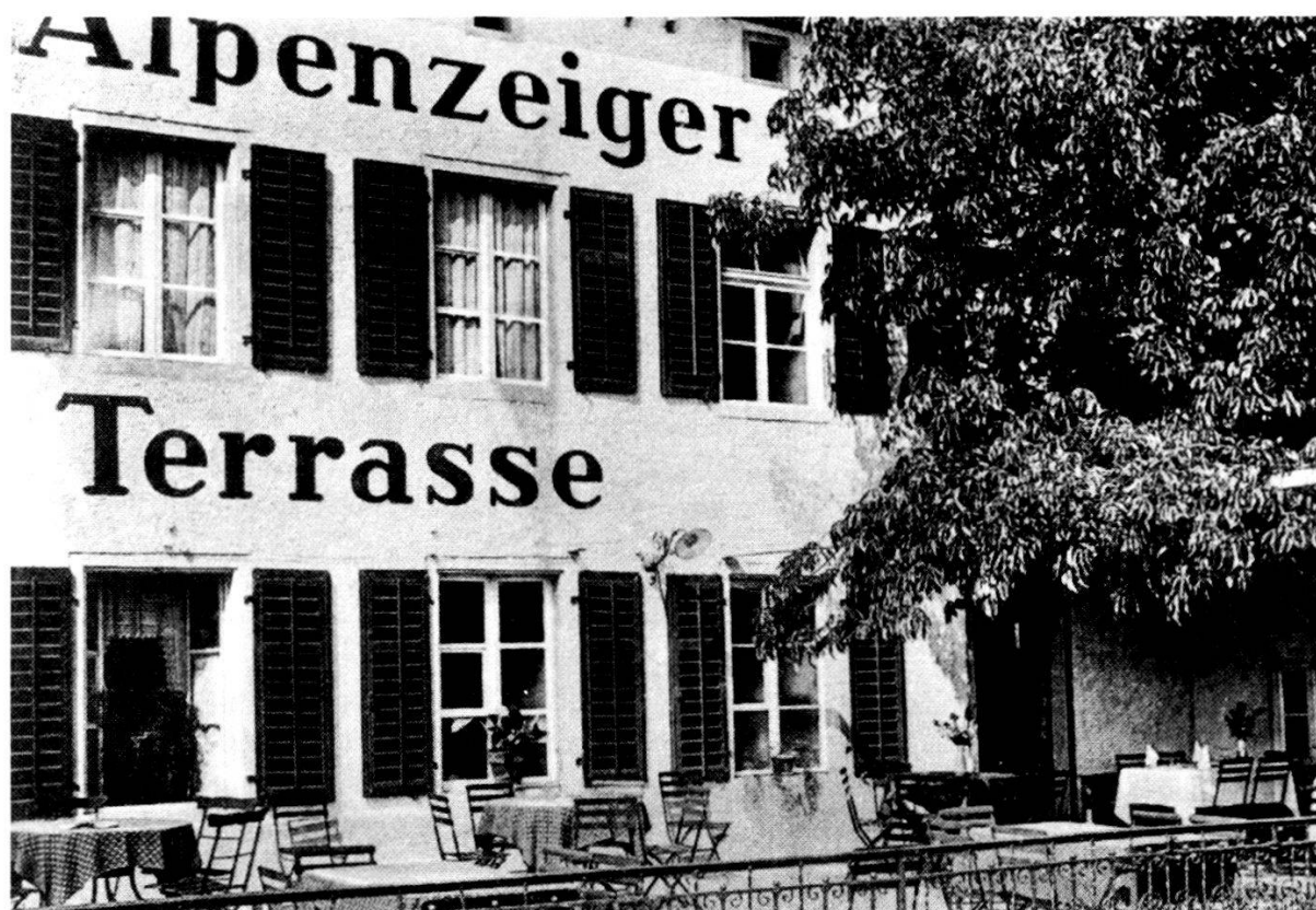
Terrasse des Restaurants Alpenzeiger um 1920