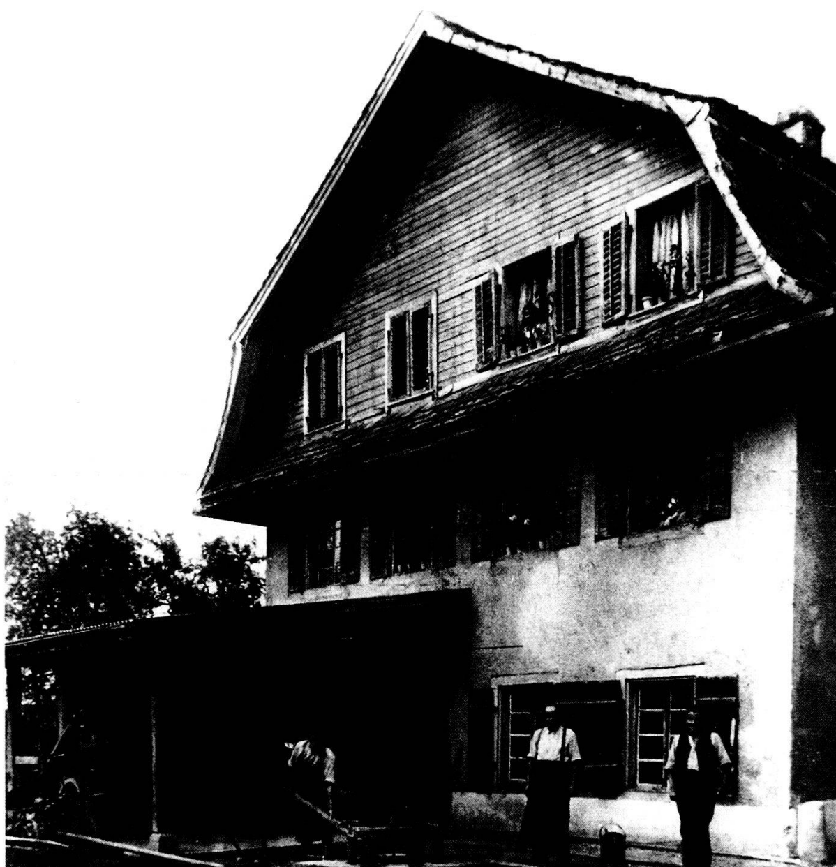
Einstige Schmiede Rüttimann in Dorfhuri

(Anm. Sektor 1: Urproduktion (Land- und Forstwirtschaft); Sektor 2: Industrielle Produktion, Handwerk; Sektor 3: Dienstleistung (Banken, Versicherungen, Gastgewerbe, öffentliche Verwaltung)