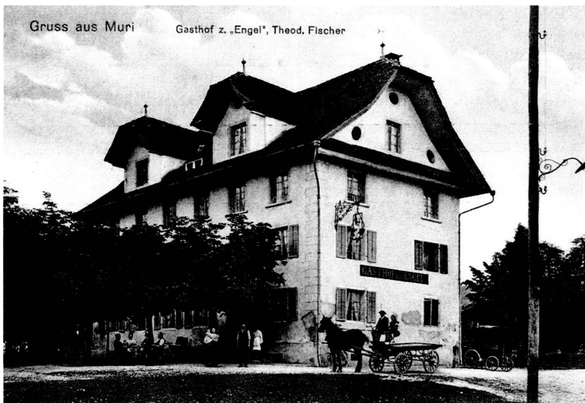
Hotel Engel um 1910