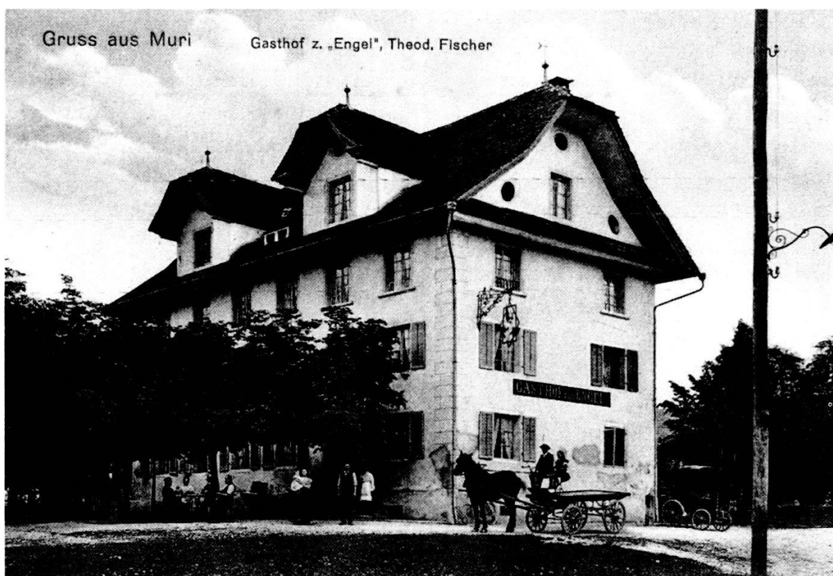
Hotel Engel um 1910