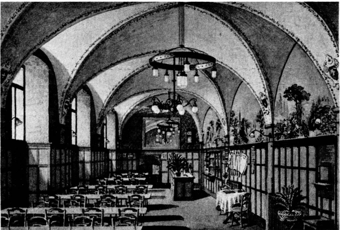
Restaurant des Hotels Löwen