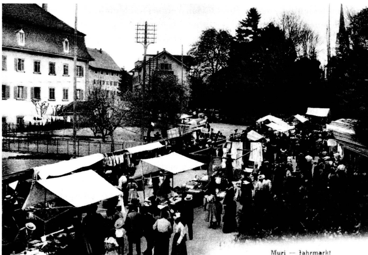
Muri — Jahrmarkt

Wieder einmal, es war unterdessen 1877 geworden, entschloss sich der Gemeinderat im Einverständnis mit den Bürgern, die Regierung nochmals um einen fünften Jahr- und Viehmarkt zu bitten. Zwei Jahre geschah aber nichts. Erst am 24. August 1879 beschloss die Gemeindeversammlung, es möchte auf das Fest Mariä Geburt ein fünfter Markt «anbegehrt» werden 42 . Der Gemeinderat begründete das Gesuch mit der Feststellung, dass seit dem Betrieb der Eisenbahn bis Muri die Jahrmärkte und besonders die Viehmärkte ein grosses Bedürfnis seien. «Wir sind überzeugt, dass die Viehmärkte in Muri als dem Mittelpunkt einer grossen Viehzucht und Viehhandel treibenden Bevölkerung besonders wichtig und berühmt werden, sobald die Eisenbahn weiter fortgesetzt sein wird.» Die Einführung eines weiteren Viehmarktes sei für die Gegend ein Bedürfnis, denn im Herbst müsse sich mancher Landwirt nach Zugvieh umsehen. Der 8. September, der ehemalige Festtag Mariä Geburt, werde sich als Markttag besonders eignen, da an diesem «abgerufenen Feiertag» viele Landwirte lieber einen Markt besuchen als auf dem Felde arbeiten 43 . Am Schlusse seines Schreibens meinte der