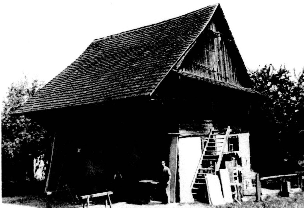
Einstige Schreinerei Lüthi im Vorderwey