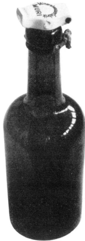
Mineralwasserflasche 3 dl der Mineralwasserfabrik Muri