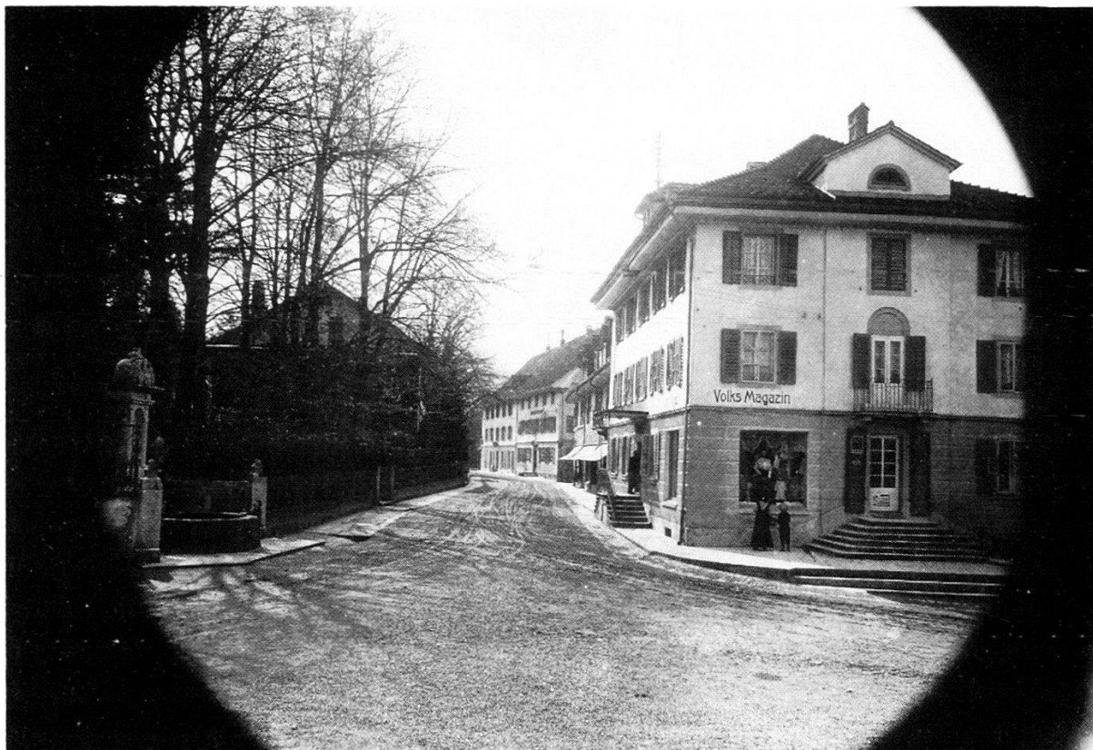
Seetalstrasse um 1920 mit Volksmagazin Bütler (heute Café Stern), Leontiusbrunnen und Hotel Ochsen