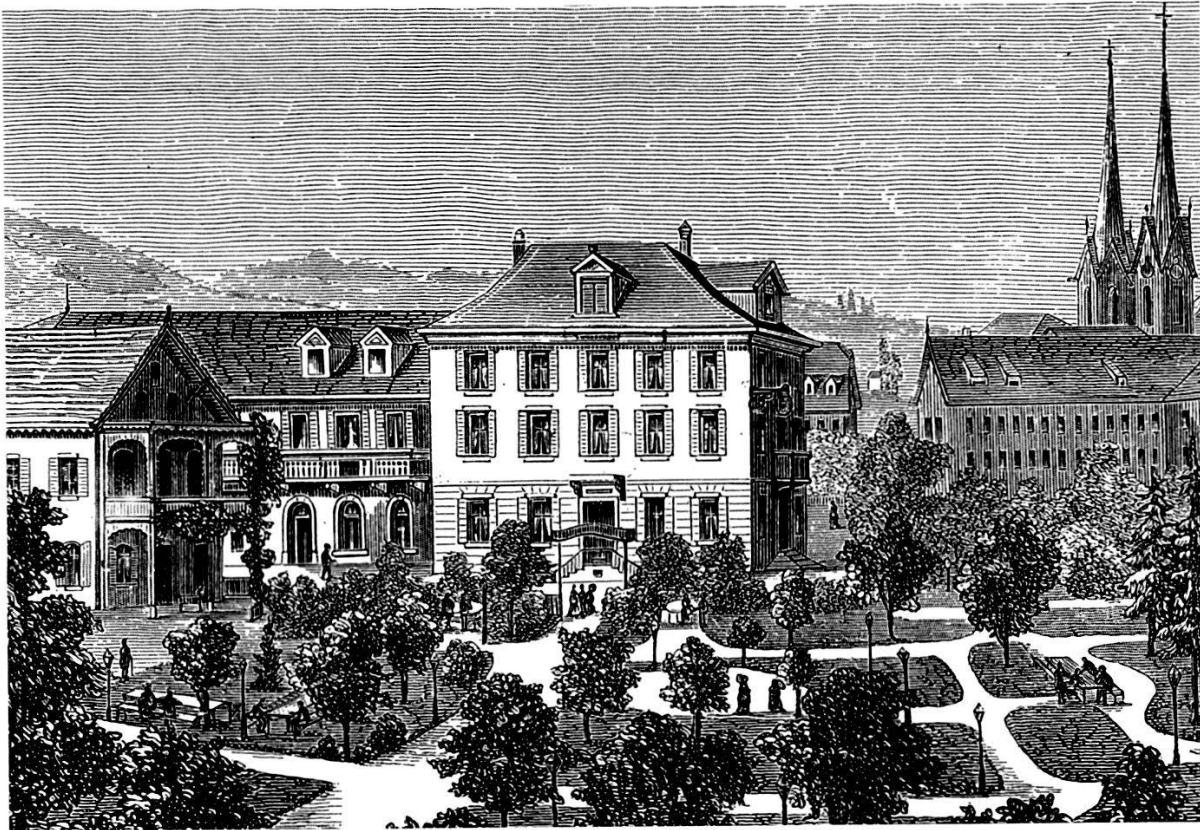
Mineral- und Solbad Muri mit Badehaus (links), Löwen (Mitte) und englischem Garten

Solbades in Muri. Das Badeetablissement soll geschmackvoll und geräumig eingerichtet gewesen sein, es verfügte über hohe Korridore und geräumige Badezimmer. Darin standen in der Regel zwei Badewannen. Das Wasser konnte durch die Einrichtung einer doppelten Röhrenleitung beliebig kalt oder warm verwendet werden. Es gab Dusche- und Brauseeinrichtungen, ausserdem Einrichtungen für Sitzbäder, lokale Hand- und Armbäder sowie ein zweckmässig konstruierter Sessel zur Applikation von Vaginal- und Uterusduschen. Nach Dr. Weibel waren folgende Kuren in Muri möglich: