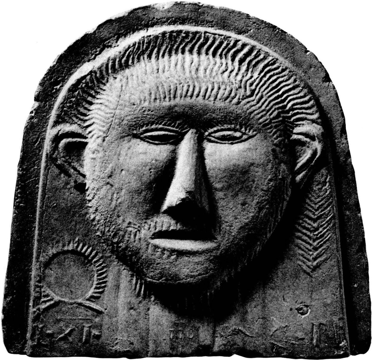
Stirnziegel mit Darstellung eines Gallierkopfes, Abbildung aus «Die Römer im Aargau»