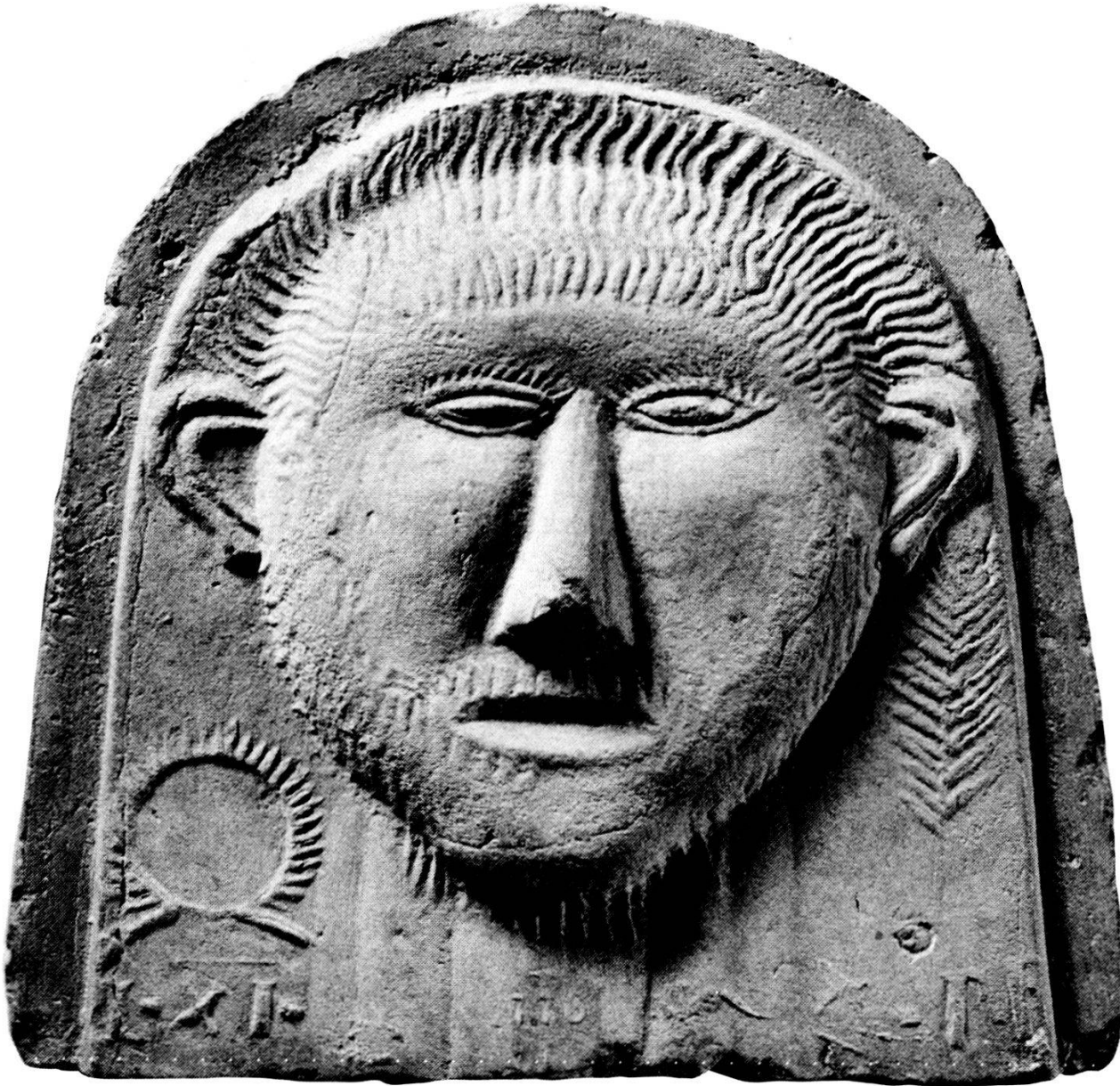
Stirnziegel mit Darstellung eines Gallierkopfes, Abbildung aus «Die Römer im Aargau»