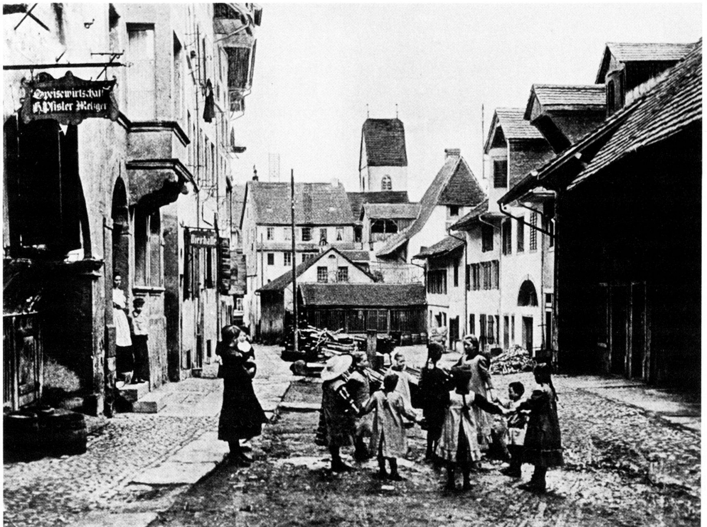
Abbildung 35: Hendschiker Kirchweg – typisch für Lenzburg während Jahrhunderten: Handwerker, die gleichzeitig noch Landwirtschaft treiben. Handwerksboutiquen links, Ökonomiegebäude rechts auf dem Bild, dazwischen spielende Stadtjugend