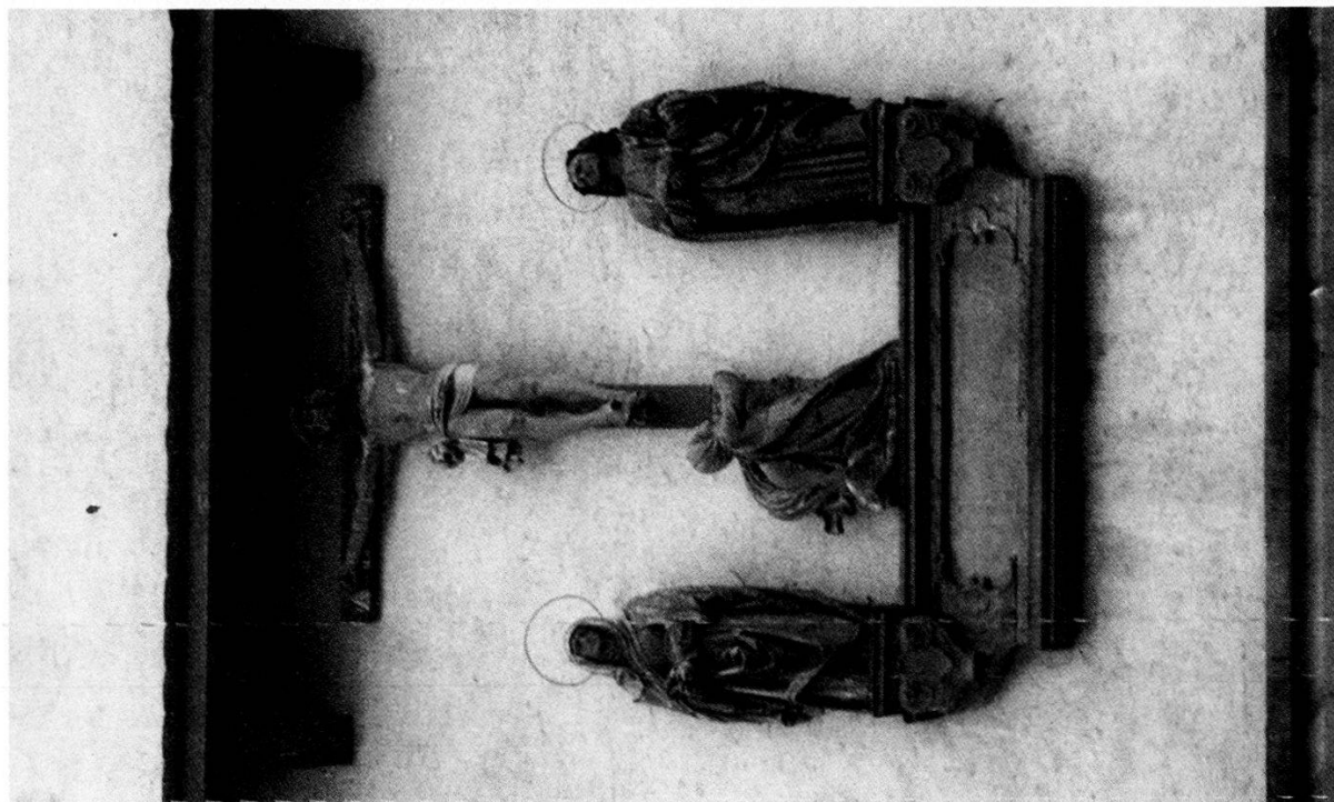
Abbildung 12 Pfarrhausportal