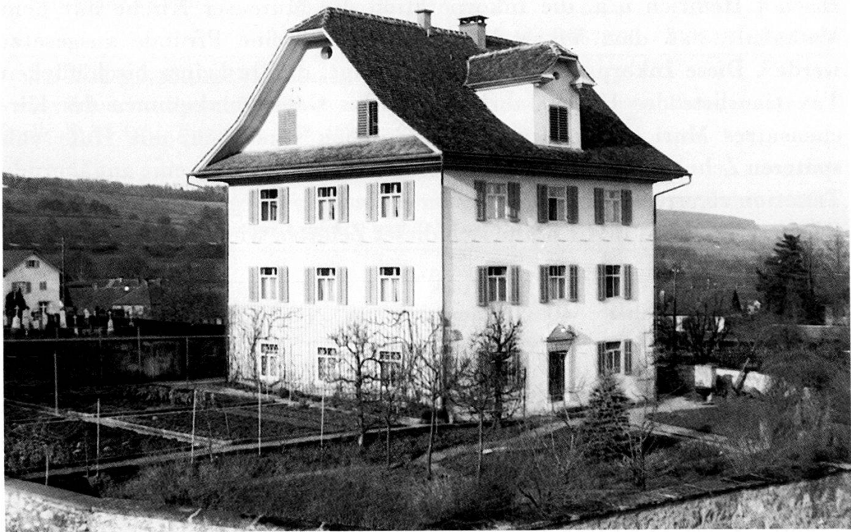
Abbildung 10 Pfarrhaus Muri heute