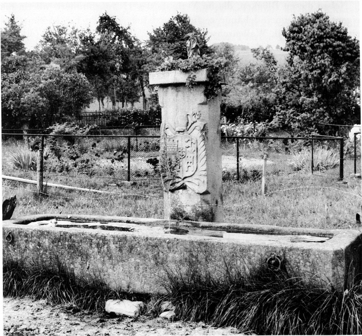
Abbildung 13 Brunnen mit Wappen des Abts Plazidus Zurlauben in Muri/Wili