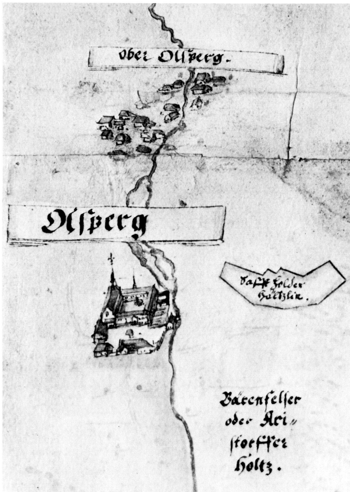
Kloster und Dorf Olsberg von Westen, um 1602