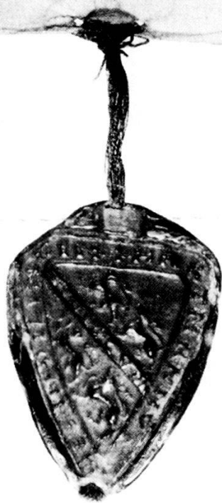
Graf Hartmann von Dillingen verkauft seinen Grundbesitz in Wettingen samt dem Patronatsrecht der Kirche und seinen sonstigen Rechten daselbst um 660 Mark dem Edlen Heinrich von Rapperswil zum Zwecke der Klostergründung 1227 Originalpergament mit dem Siegel des Verkäufers