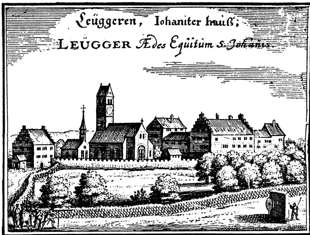
Stich aus der Topographia Helvetiae von MATTHAEUS MERIAN 1642

seine Komturwohnung im Konventhaus wieder wohnlich einzurichten. Nachdem er bis zum Jahre 1708 wesentliche Verbesserungen ( Melioramente ) an Bauten und Gütern durchgeführt hatte, verlangte er eine Visitation, die ihn zur Entschädigung berechtigen sollte. Neu erbaut waren die Küche im Galeriebau samt Innenausstattung, ferner eine Speisekammer und Treppen in die Keller. Die erneuerte Komturwohnung ließ er mit Möbeln und Hausrat versehen. An den Ökonomiebauten waren ebenfalls weitgehende Verbesserungen festzustellen, die sich, zusammen mit den übrigen Veränderungen, einbezogen die Trotte im Girsberg und das Meierhaus zu Hettenschwil, auf beinahe 3000 Reichsgulden beliefen. Ein Dokument seiner Restaurierung, sein Wappenrelief in Sandstein mit der Jahrzahl 1708 am Komturhaus, wurde beim neuesten Umbau 1959 entfernt 25 . Nach seiner Wahl zum Statthalter des Großkomturs zu Heitersheim war er seit 1708 öfters in Geschäften abwesend, so daß er auf 1. Mai 1709 die Kommende für fünf Jahre ver-