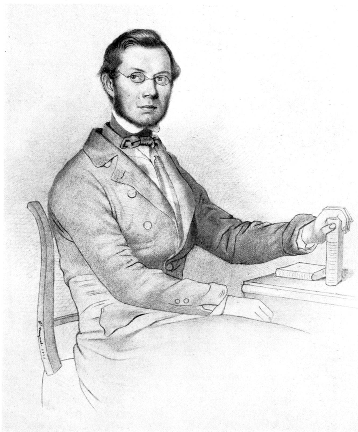
ERNST LUDWIG ROCHHOLZ