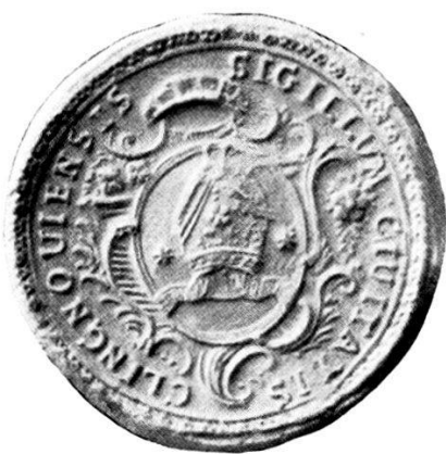
3. SIGILLUM · CIUITATIS · CLINGNOUIENSIS.