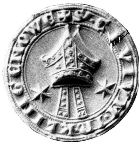
2. † S r CIVIUM · IN · KLINGENOWE.