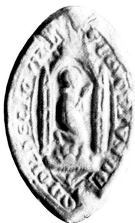
5. S r CONVENTUS · DE · (SI)ON · ORD · SCI · GVILELMI.