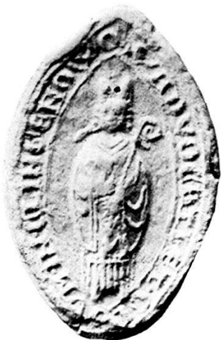
1. S r ADVOCATI · ET · CIVIUM · IN · CLINGENOWO.