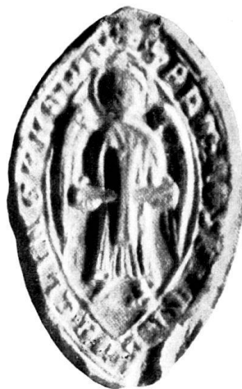
6. S r F̄RM · HOSPITAL(ARIORVM) · DE · CLINGENOWE.

1.—5. Stadtſiegel von 1278, 1500 und um 1700.