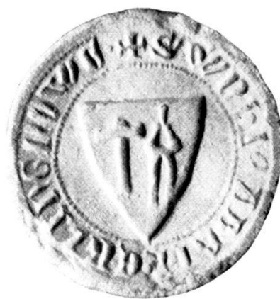
4. † S r W̄NHI · (F)ABRI · DE · KLINGNOWE.