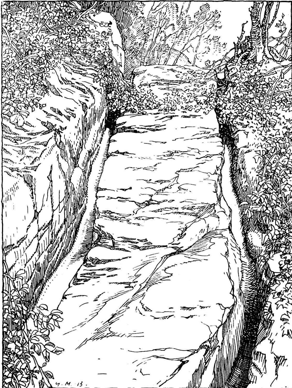
Der helvet.-römische Karrenweg am Bözberg, „Im Berg“ oberhalb Effingens.

c) Um 1510 war im Zuge der Wege zum Gotthard nur noch der Bözberg eine Erinnerung an die Tage, wo die Habsburger sich mit dem Gedanken beschäftigen konnten, den Gotthard-Paß selbst zu gewinnen. 9