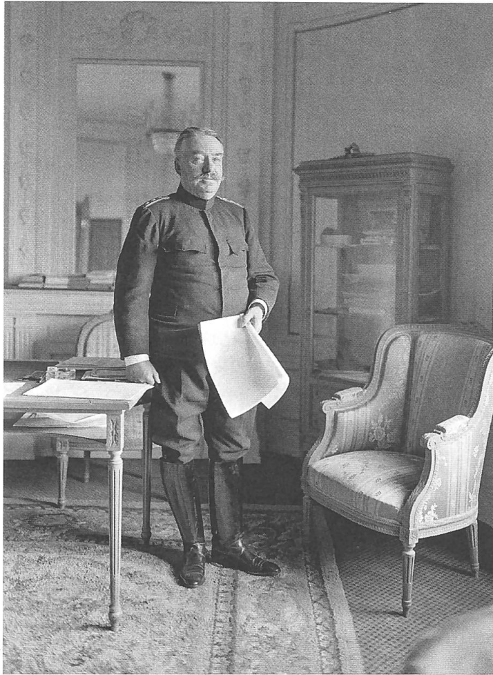
Der General als «Gnadenherr».

sowie andererseits aus seinen Schreiben an den zuständigen Brigade- sowie Divisionskommandanten zu den verschiedenen Vorkommnissen rund um die 12. Infanterie-Brigade. Aus diesen Quellen wird deutlich, dass er die Verantwortung für diese Vorkommnisse bei den zuständigen Offizieren sah, deren Verhalten er als nicht konform mit den von ihm bereits seit drei Jahrzehnten gebetsmühlenartig gepredigten Ansichten über autodynamische Disziplin durch soldatische Erziehung und spritzige Offiziersautorität bewertete. 56 So schrieb er am 13. Mai 1918 an den Kommandanten der 12. Infanterie-Brigade, dass in den Vorkommnissen des sechsten Ablösungsdienstes lediglich der «in der Truppe latent vorhandene Geist der Indisziplin an die Oberfläche» getreten war. 57 In seinem am gleichen Tag verfassten Schreiben an den Kommandanten der 4. Division machte er denn auch klar, worauf er diese latent vorhandene Indisziplin zurückführte. So sei nach seiner Ansicht «die Ursache aller Vorkommnisse der gänzliche Mangel menschlicher und soldatischer Erziehung dieser Truppe», was gemäss Wille unter dem Kommando von Offizieren, welche es «möglichst vermieden, ihre Truppe in schlechte Laune zu versetzen» auch nicht verwunderlich sei. 58 Wille verglich mit der für ihn typisch spitzen