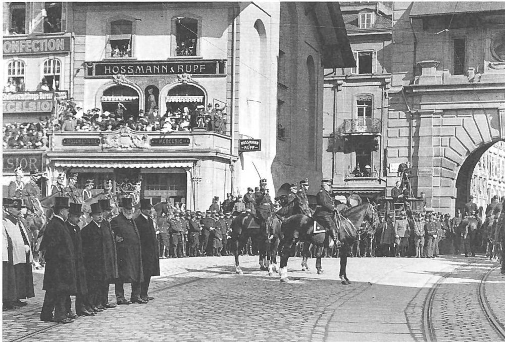
Von den kriegswirtschaftlichen und aussenhandelspolitischen Herausforderungen des Weltkrieges gleichermaßen überfordert: Bundesrat und Armeeführung im Ersten Weltkrieg (Bild: BAR, wikimedia).