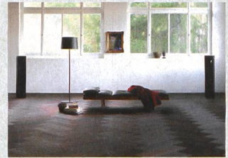
Formpark di Bauwerk La rivisitazione del parquet

In collaborazione con Arik Levy, Kaldewei amplia la propria collezione premium Meisterstück con un nuovo modello di vasca e lavabo abbinato. La vasca freestanding, completamente smaltata, è caratterizzata da un bordo che sale leggermente. La vasca da bagno Meisterstück Emerso di Kaldewei sviluppata da Levy, con gli alti schienali e il fondo lungo, offre una moderna ed ergonomica interpretazione delle vasche da bagno storiche. La vasca è dotata di un rivestimento senza fughe, di una copertura dello scarico a filo e di un discreto troppopieno in acciaio smaltato. Il lavabo abbinato è complementare, con il bordo che sembra immergersi nella base. Grazie alla sua forma completamente smaltata, il lavabo Meisterstück Emerso può essere montato in due diverse posizioni, con il bordo a salire rivolto verso l'interno o verso la parete della stanza da bagno. È disponibile nelle varianti freestanding e da incasso.