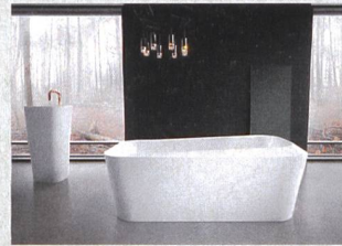
Arik Levy disegna per Kaldewei

Via Figino 14 - CP228 - CH - 6917 BARBENGO - Tel. 091 980 01 24 / 25 - Fax 091 980 01 26 manutecnica@sunrise.ch - www.manutecnica.ch - LONGHINI GILLES 079 621 21 80