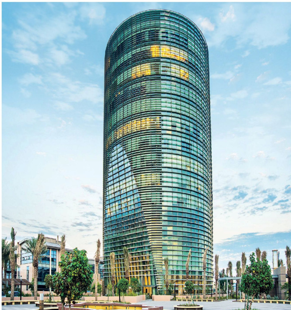
Alturki Business Park Al-Kohbar, Saudi Arabia