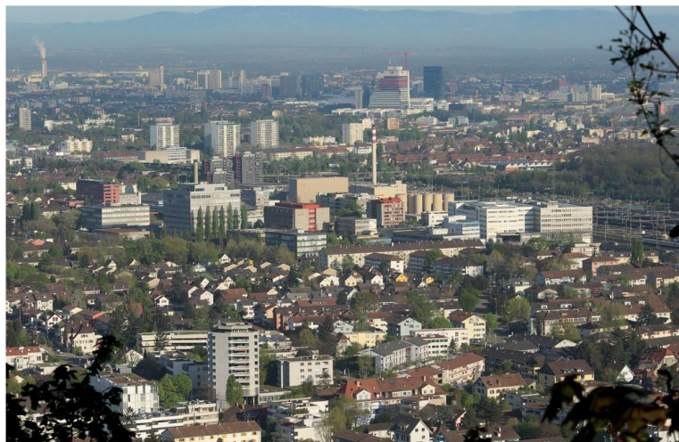
Il quartiere Polyfeld di Muttenz: un esempio di densificazione centripeta qualitativa.

La grande sfida dei progettisti è insita nei numerosi agglomerati risalenti agli anni Cinquanta e Sessanta, edifici che, per la maggior parte, non sono più in grado di soddisfare le attuali esigenze, né dal punto di vista energetico, né per quanto concerne le planime-