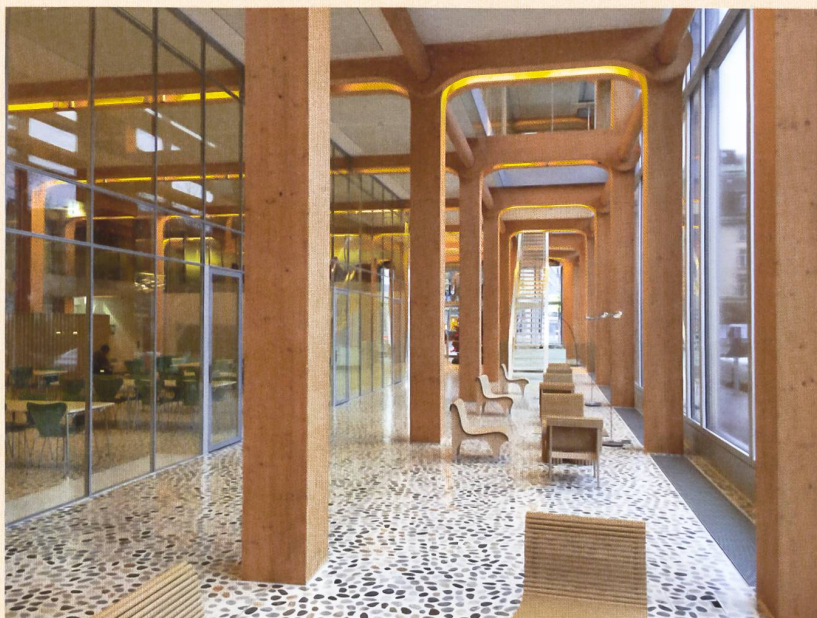
1 Interni della casa editrice Tamedia, opera di Shigeru Ban, Zurigo.