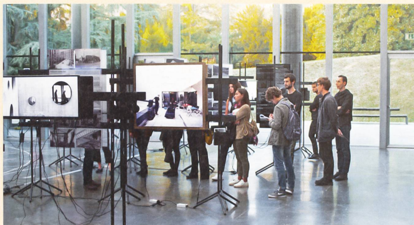
1 Un gruppo di studenti dell'Accademia visita l'esposizione.