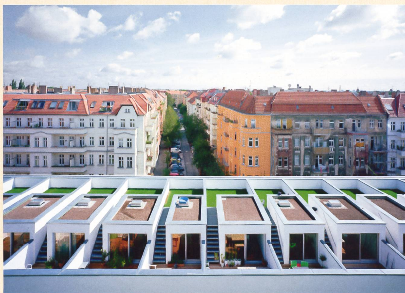
1 Complesso abitativo opera dello studio Zanderroth Architekten, Prenzlauer Berg (Berlino).

Berlino è una città in espansione, si deve pertanto costantemente confrontare con una miriade di sfide nella progettazione. La sfera politica e i progettisti responsabili riescono a tener testa alla crescita, modellando il contesto urbano in modo innovativo? A inizio giugno 2018, l'associazione di specialisti SIA a & k, insieme a SIA Form, condurrà un viaggio di studio, rivolto agli architetti, agli urbanisti e agli architetti paesaggisti, alla scoperta della scena architettonica di Berlino. In programma vi sarà la visita alle gemme architettoniche che la capitale offre e un giro d'orizzonte sugli sviluppi vissuti dai quartieri berlinesi. Si parlerà di conservazione dei monumenti nel contesto urbanistico e visiteremo edifici abitativi di ultimissima generazione, costruiti con spirito oltremodo innovativo. Berlino è una città in cui il sogno di far rinascere un abitare urbano, attento ai bisogni della vita familiare, si è trasformato in realtà, e ciò nelle forme più diverse. Il viaggio di studio sarà arricchito da interventi di esperti. Il programma comprende, accanto alla visita di edifici contemporanei, anche un excursus alla scoperta di alcune opere selezionate che si ascrivono al Movimento Moderno.