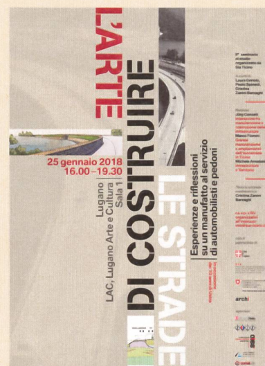
1 La locandina del seminario L'arte di costruire le strade .

È previsto l'allestimento di una mostra fotografica, aperta al pubblico, che ripercorra le principali tappe della co-