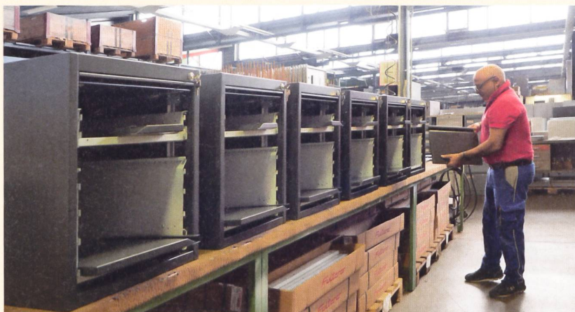
1 In produzione vige un triplice controllo della qualità: al termine di ciascuna fase di produzione, al montaggio del singolo pezzo finito e al momento della spedizione.

La filosofia: l'azienda avverte l'esigenza di investire sui processi di progettazione e produzione, sulla qualità dei materiali utilizzati e sul capitale umano. Queste scelte permettono oggi di raggiungere e consolidare elevati standard di qualità e di disporre di un personale altamente qualificato e affidabile.