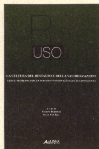
Stefano Bertocci, Giovanni Minutoli, a cura di Re-uso. La cultura del restauro e della valorizzazione Temi e problemi per un percorso internazionale di conoscenza Alinea, Firenze 2014

Avete la possibilità di ordinare i libri recensiti all'indirizzo libri@rivista-archi.ch (Buchstämpfli, Berna), indicando il titolo dell'opera, il vostro nome e cognome, l'indirizzo di fatturazione e quello di consegna. Riceverete quanto richiesto entro 3/5 giorni lavorativi con la fattura e la cedola di versamento. Buchstämpfli fattura un importo forfettario di Fr. 8.50 per invio + imballaggio.