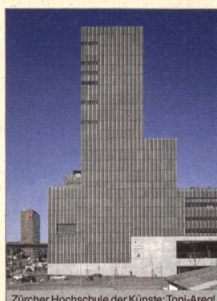
Janine Schiller, Katharina Nill, a cura di Zürcher Hochschule der Künste: Toni-Areal Zürcher Hochschule der Künste ZHdK, Scheidegger & Spiess, Zurich 2016