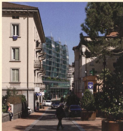
3 T 4

bellezze e brutture e manchevolezze - quali quartieri proteggere, quali aree lasciare a verde o dove crearne delle nuove, quale area urbana occorre qualificare nel densificare, dove realizzare delle piazze e dei percorsi pedonali, e in quali luoghi è possibile e opportuno creare dei quartieri nuovi di zecca.