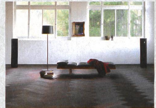
Formpark di Bauwerk La rivisitazione del parquet

In collaborazione con Arik Levy, Kaldewei amplia la propria collezione premium Meisterstück con un nuovo modello di vasca e lavabo abbinato. La vasca freestanding, completamente smaltata, è caratterizzata da un bordo che sale leggermente. La vasca da bagno Meisterstück Emerso di Kaldewei sviluppata da Levy, con gli alti schienali e il fondo lungo, offre una moderna ed ergonomica interpretazione delle vasche da bagno storiche. La vasca è dotata di un rivestimento senza fughe, di una copertura dello scarico a filo e di un discreto troppopieno in acciaio smaltato. Il lavabo abbinato è complementare, con il bordo che sembra immergersi nella base. Grazie alla sua forma completamente smaltata, il lavabo Meisterstück Emerso può essere montato in due diverse posizioni, con il bordo a salire rivolto verso l'interno o verso la parete della stanza da bagno. È disponibile nelle varianti freestanding e da incasso.