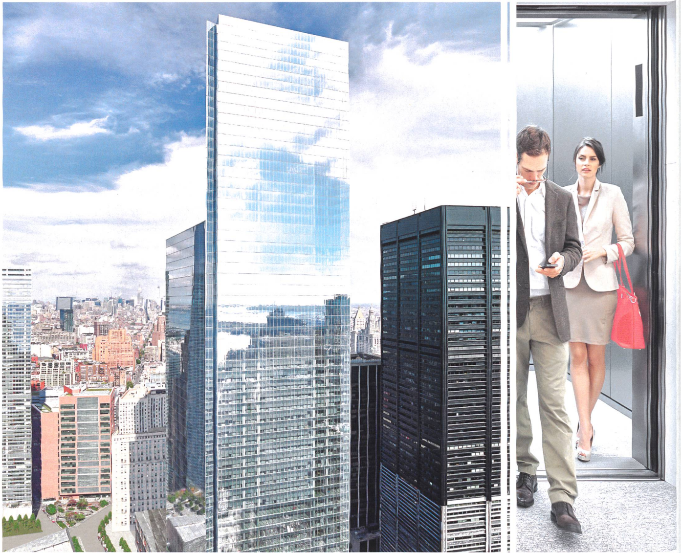
4 World Trade Center, New York