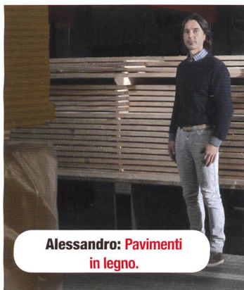
Alessandro: Pavimenti in legno.