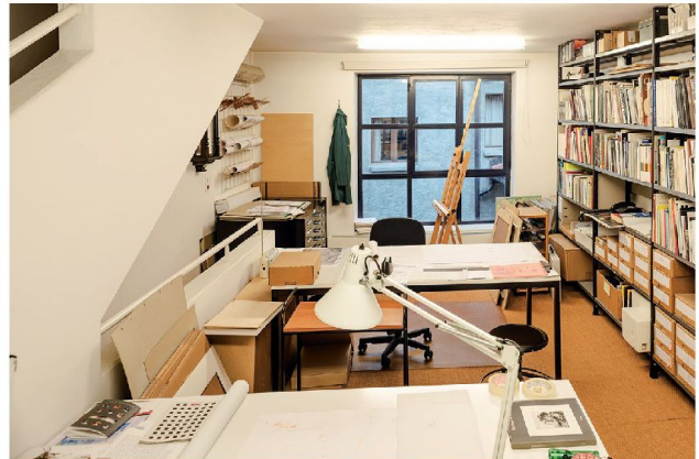
1.-6. Lo studio al piano terreno, l'ufficio al primo piano, l'atelier al secondo piano. Nella pagina seguente dettagli degli strumenti di lavoro.