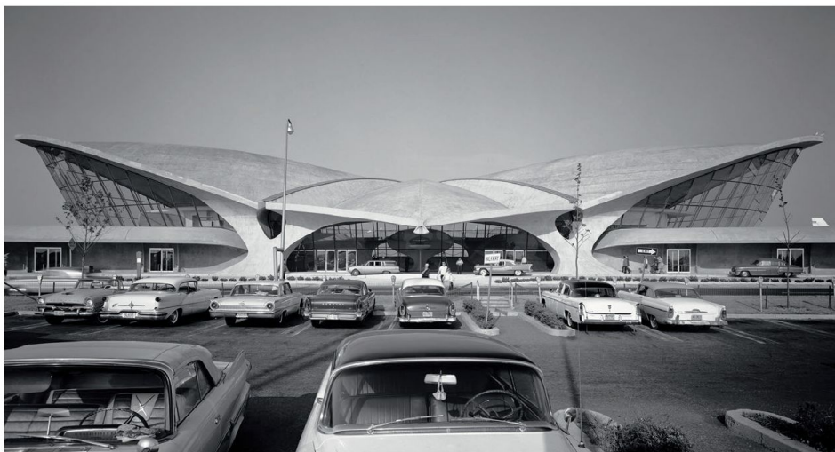
5. - 6. Alberto Burri, Cretto a Gibellina, 1989 7. Eero Saarinen, Terminal TWA all'Idlewild Airport, New York 1962, ora JFK Airport. © Ezra Stoller/Esto, Yossi Milo Gallery