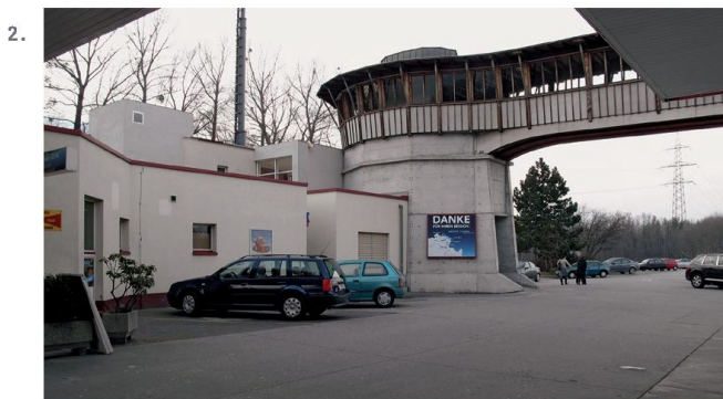
1. - 2. Miller e Maranta, autostrada A13, passerella pedonale a Sevelen, 1990