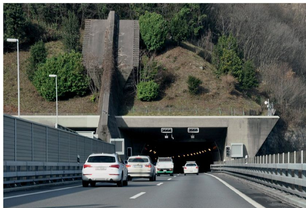
3. - 4. Rino Tami, autostrada A2, portale della galleria a Melide, 1967

Gibellina di allora. È una scultura è una land art è un'architettura che nel silenzio di quella collina configurano l'impianto urbanistico di quel tempo e dove è sepolta la memoria di ciò che fu, le stanze e le cantine e le vie e i lastricati. Ammirare da lontano il Cretto di Burri non significa rivivere Gibellina, no: è comprenderne la forma ed emozionarsi dell'enormità della tragedia, è l'astrazione di una realtà che più non esiste. Si è fatta opera d'arte. Così, il percorrere gli spazi tra i cubi bianchi è certamente ricalcare le vie e i ripidi vicoli di allora, ma soprattutto significa entrare dentro questa enorme scultura, intravedere verso valle il paesaggio lontano, sentire il silenzio profondo di questo luogo isolato.