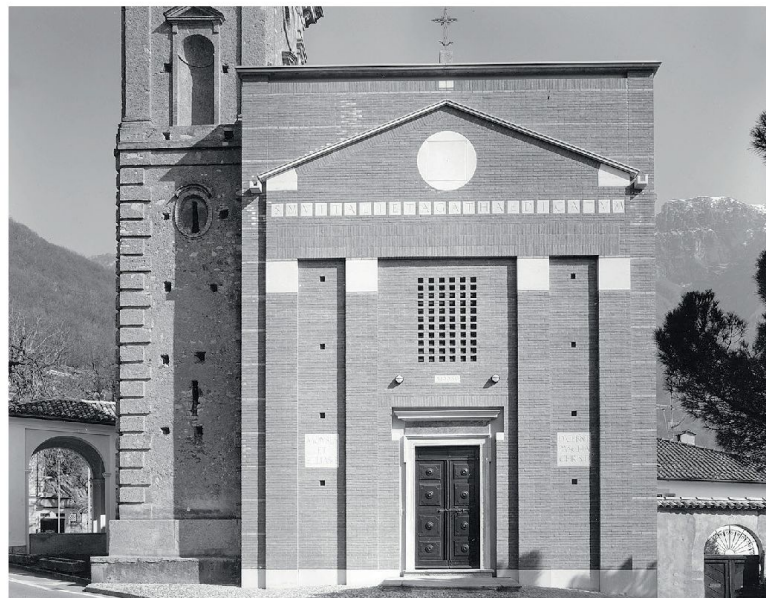
Facciata Chiesa Parrocchiale dei Santi Vitale e Agata Rovio, 1996-97.