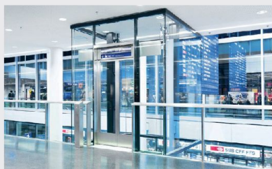
Stazione Aarau: Gli ascensori trasparenti non limitano la prospettiva.

AS realizza impianti di sollevamento standard per quasi tutte le applicazioni. Non sempre, però, le soluzioni standardizzate soddisfano automaticamente le singole esigenze individuali, come mostrano gli esempi citati. A San Gallo, Aarau e St. Moritz come in altre città della Svizzera, i tecnici e gli ingegneri di AS apportano tutta la competenza necessaria per rispondere a ogni tipo di esigenza e la capacità di sviluppare soluzioni specifiche e innovative.