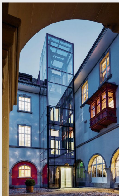
Il Museo storico ed etnografico di San Gallo: Il vano ascensore vetrato crea un moderno contrasto con l'edificio storico.

Si è ricorsi a soluzioni non convenzionali anche per riportare agli standard attuali l'accessibilità a un quartiere a terrazze di St. Moritz, costruito nei primi anni Novanta. La vecchia funicolare che permetteva di raggiungere i tredici appartamenti, si-