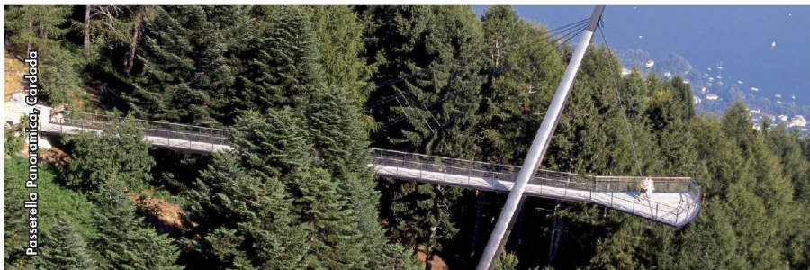
Passerella Panoramica, Gardada

Fondazione per la Dinamica Strutturale e l'Ingegneria Sismica Sempacherstrasse 77 8032 Zürich t. +41 79 740 36 79 info@baudyn.ch www.baudyn.ch