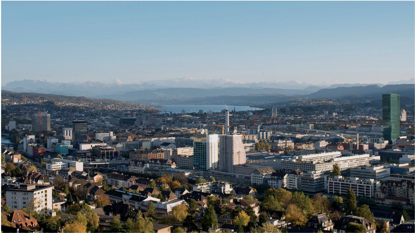
Vista della città dalla collina di Zurigo-Höngg. Foto Juliet Haller, Amt für Städtebau della città di Zurigo

cazione di interi quartieri o edifici pubblici. Questo fa sì che noi, a Zurigo, possiamo dire di avere un ambiente molto vivace dal punto di vista architettonico. Ci sono molti uffici, anche giovani, che grazie ai concorsi hanno la possibilità di mettere alla prova le proprie capacità, di ottenere incarichi e alla fine di realizzare i loro progetti.