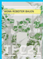
Tec21 n. 15-16 WENN ROBOTER BAUEN www.tec21.ch