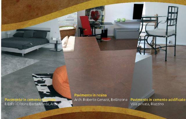
Pavimento in cemento decorativo Il Loft - Cristina Berta Arreda, Arbedo

Pavimento in cemento decorativo acidificato... Esteticamente unico!