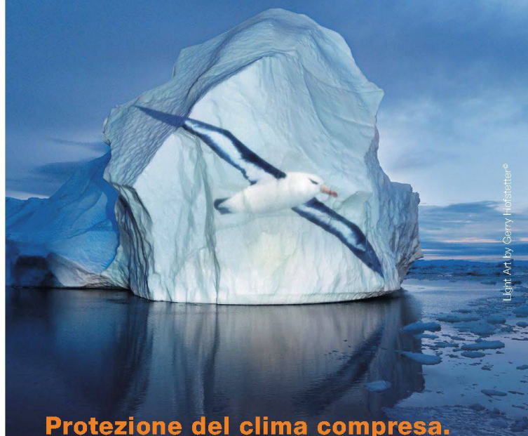
Light Art by Gerry Holstetter