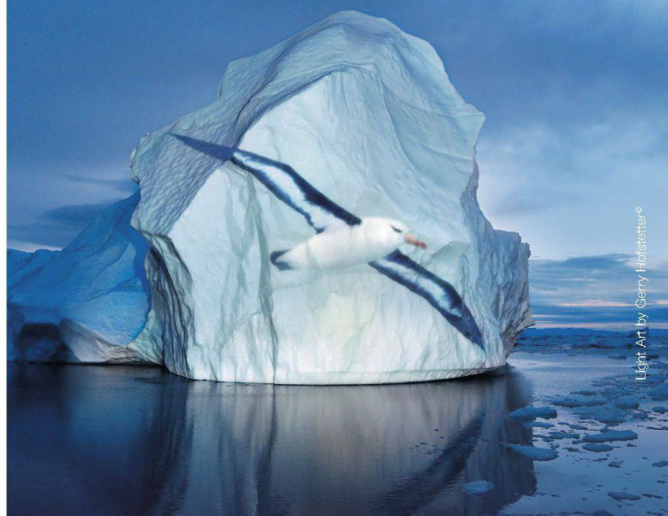
Light Art by Gerry Hofstetter