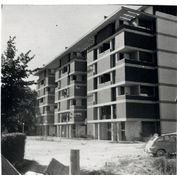
Immagini che illustrano il Rapporto finale del 1957.