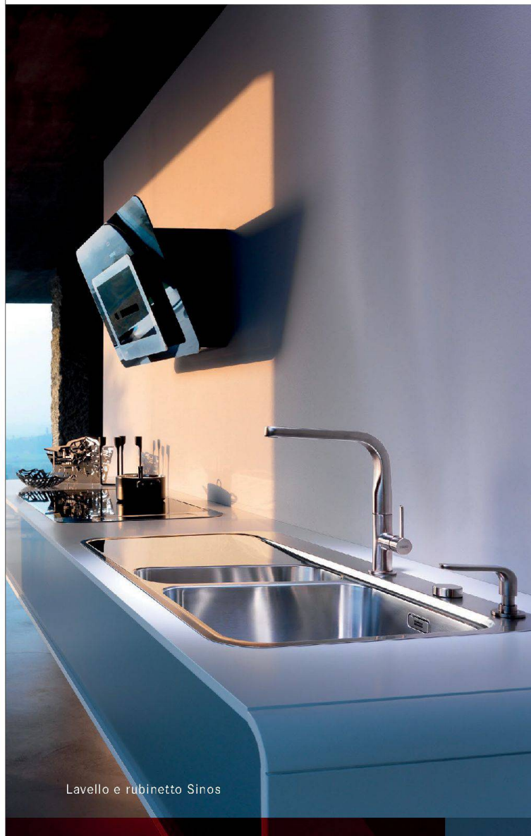
Lavello e rubinetto Sinos

Tobler Domotecnica SA via Sarta 8 6814 Lamone t. +41 91 935 42 42 f. +41 91 935 42 43 frontoffice.lamone@toblerag.ch www.haustechnik.ch