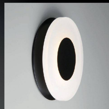
CORONA LED ROUND 30 W / 2300lm / 3000K Ø 290mm