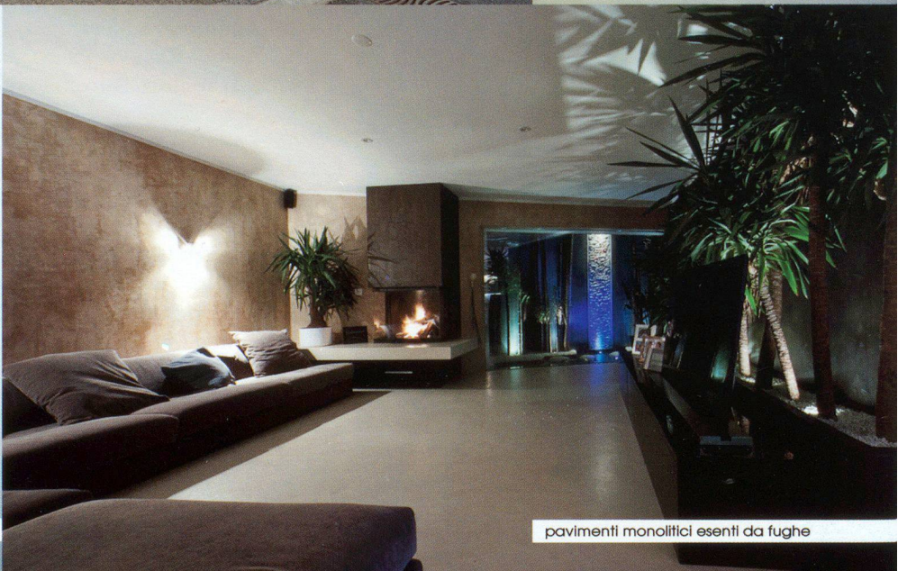
pavimenti monolitici esenti da fughe