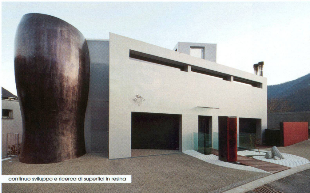
continuo sviluppo e ricerca di superfici in resina

Rivestimenti in resine decorative per pavimenti e pareti senza fughe, spessore 3 - 4 mm, applicabili senza demolizioni su qualsiasi sottofondo: - su pavimenti riscaldati - su piastrelle - su scale - su pietra, marmi, ecc... - in box docce