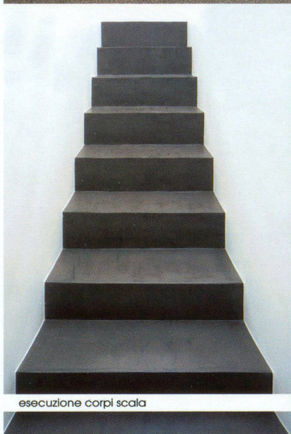
esecuzione corpi scala