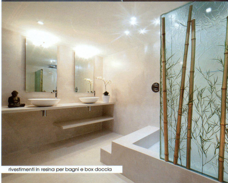
rivestimenti in resina per bagni e box doccia