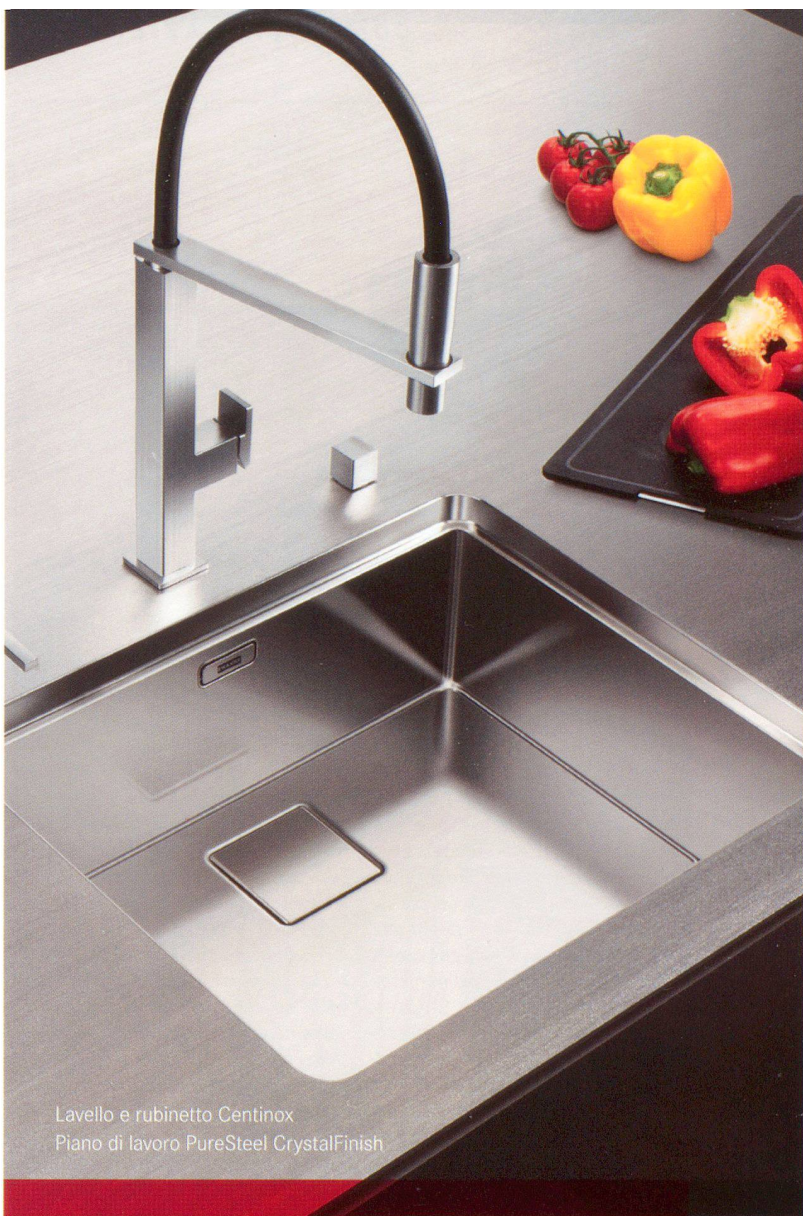
Lavello e rubinetto Centinox Piano di lavoro PureSteel CrystalFinish