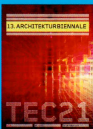
Tec21 n. 13 ARCHITEKTURBIENNALE www.tec21.ch