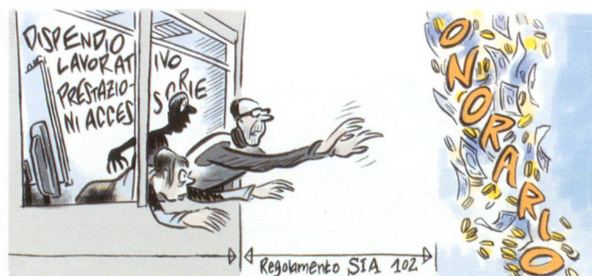
Illustrazione: Nicola Bischof, Zurigo

Nel caso concreto, le parti non hanno specificato nel loro contratto le modalità di remunerazione dell'architetto. Le parti non hanno neppure integrato al contratto il regolamento SIA 102. Secondo il Tribunale cantonale, «le norme SIA non hanno un carattere obbligatorio generale. Si tratta, infatti, di condizioni generali private che si applicano se le parti le hanno integrate nel contratto», in particolare la norma SIA 102 «neppure può essere considerata l'espressione di un uso comune del settore». Il TF ha ritenuto che «l'osservazione dei giudici cantonali concernente la portata giuridica delle norme SIA è conforme alla giurisprudenza del Tribunale federale, secondo la quale esse non codificano un uso vincolante; tutt'al più, al pari di altre formulazioni contrattuali standardizzate, possono talvolta esprimere degli usi riconosciuti, ma la circostanza va dimostrata in ogni singolo caso». In merito al giudizio del TF va innanzitutto rilevato che siamo in presenza di regolamenti SIA e non di norme SIA.