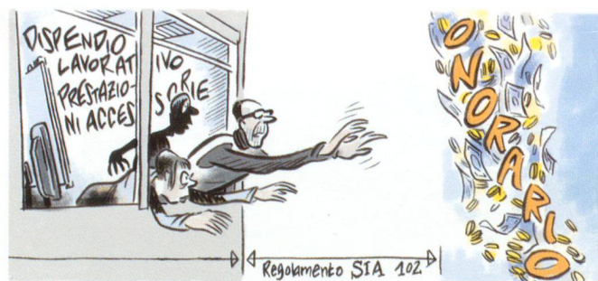
Illustrazione: Nicola Bischof, Zurigo

Nel caso concreto, le parti non hanno specificato nel loro contratto le modalità di remunerazione dell'architetto. Le parti non hanno neppure integrato al contratto il regolamento SIA 102. Secondo il Tribunale cantonale, «le norme SIA non hanno un carattere obbligatorio generale. Si tratta, infatti, di condizioni generali private che si applicano se le parti le hanno integrate nel contratto», in particolare la norma SIA 102 «neppure può essere considerata l'espressione di un uso comune del settore». Il TF ha ritenuto che «l'osservazione dei giudici cantonali concernente la portata giuridica delle norme SIA è conforme alla giurisprudenza del Tribunale federale, secondo la quale esse non codificano un uso vincolante; tutt'al più, al pari di altre formulazioni contrattuali standardizzate, possono talvolta esprimere degli usi riconosciuti, ma la circostanza va dimostrata in ogni singolo caso». In merito al giudizio del TF va innanzitutto rilevato che siamo in presenza di regolamenti SIA e non di norme SIA.