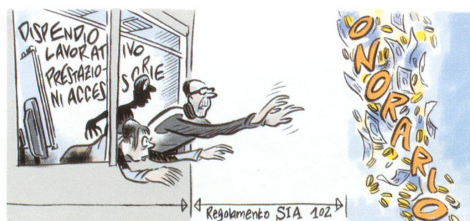
Illustrazione: Nicola Bischof, Zurigo

Nel caso concreto, le parti non hanno specificato nel loro contratto le modalità di remunerazione dell'architetto. Le parti non hanno neppure integrato al contratto il regolamento SIA 102. Secondo il Tribunale cantonale, «le norme SIA non hanno un carattere obbligatorio generale. Si tratta, infatti, di condizioni generali private che si applicano se le parti le hanno integrate nel contratto», in particolare la norma SIA 102 «neppure può essere considerata l'espressione di un uso comune del settore». Il TF ha ritenuto che «l'osservazione dei giudici cantonali concernente la portata giuridica delle norme SIA è conforme alla giurisprudenza del Tribunale federale, secondo la quale esse non codificano un uso vincolante; tutt'al più, al pari di altre formulazioni contrattuali standardizzate, possono talvolta esprimere degli usi riconosciuti, ma la circostanza va dimostrata in ogni singolo caso». In merito al giudizio del TF va innanzitutto rilevato che siamo in presenza di regolamenti SIA e non di norme SIA.