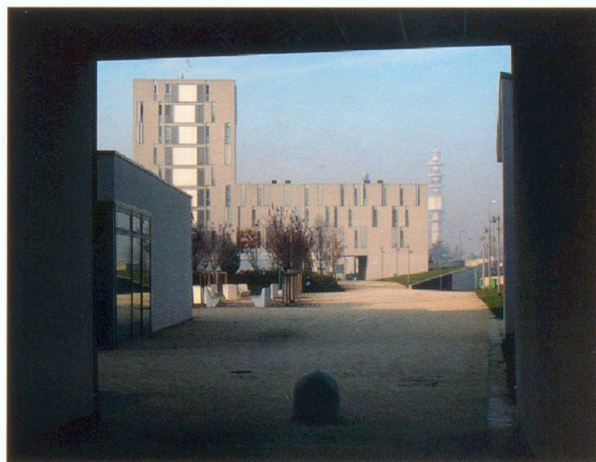
MAB Arquitectura, quartiere in via Gallarate a Milano, 2011

Gli esempi per possibili soluzioni esistono, promosse principalmente dalle grandi città, che per prime hanno conosciuto questi problemi e cercato delle soluzioni già parecchi anni fa. Non occorre andare molto lontano. Una possibile soluzione è che la città stessa realizzi le case d'appartamenti e i quartieri e i relativi spazi pubblici in luoghi qualificati della città, investendo così soldi pubblici non più nel realizzare (costose) nuove strade e allacciamenti fognari su per lontane colline o per prolungare (costose) linee di trasporto pubblico, ma per creare luoghi per abitare dentro la città. Insieme abitativi capaci di offrire agli