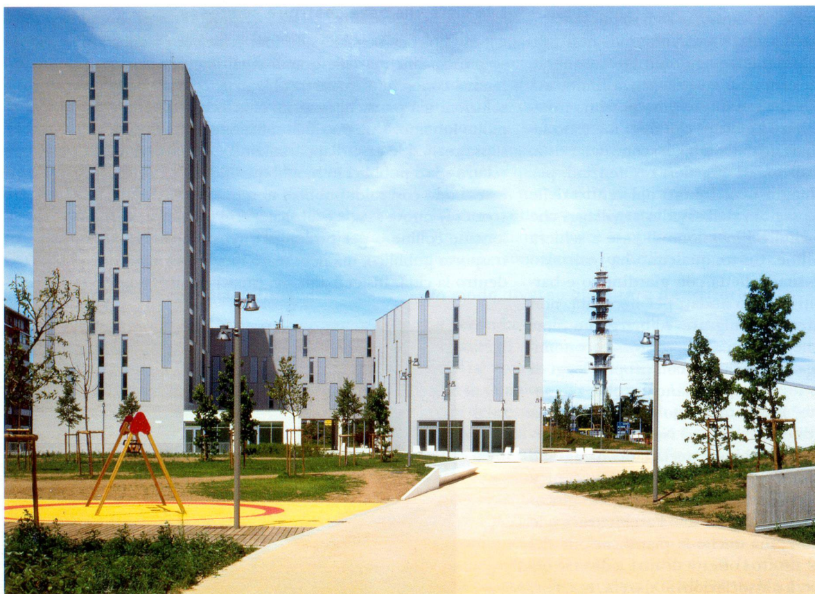
MAB Architectura, quartiere in via Gallarate a Milano, 2011

questi ultimi anni la costruzione di nuovi quartieri di grande interesse. Nati anch'essi dalla collaborazione città e investitori, progettati tramite concorsi di architettura e realizzati da privati, fondono gli interessi degli uni con quelli degli altri. Nel senso che in questi nuovi quartieri trovano spazio sia dei contenuti misti come le abitazioni e i commerci, sia tipologie diverse di appartamenti, da quelli di grande lusso a quelli più semplici, sia ancora la creazione di parcheggi sotterranei e percorsi pedonali e piazze aperte al pubblico. E dove l'investitore privato ha comunque il suo tornaconto economico nell'alta densità edificatoria e potendovi inserire non solo abitazioni ma anche negozi e supermercati. Luganese e Mendrisiotto e Locarnese e Bellinzonese – per non parlare della «Città Ticino» – sono oramai dei grandi agglomerati e devono trovare nuove strade di sviluppo. Diverse, complementari ma non alternative, ai Piani Regolatori. Attive, e non passive: per far sì che l'osservazione scritta da Alberto Caruso «... la necessità di una svolta nella cultura dell'abitare, che limiti e recuperi la diffusione insediativa... trovi una possibile risposta e non rimanga ... un'aspirazione teorica».