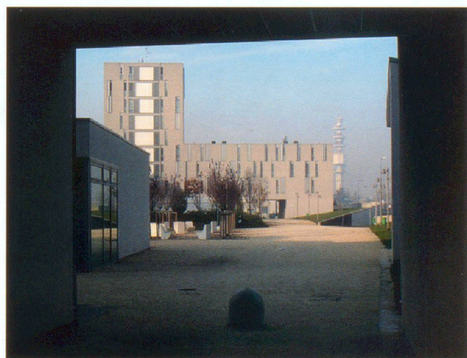
MAB Arquitectura, quartiere in via Gallarate a Milano, 2011

Gli esempi per possibili soluzioni esistono, promosse principalmente dalle grandi città, che per prime hanno conosciuto questi problemi e cercato delle soluzioni già parecchi anni fa. Non occorre andare molto lontano. Una possibile soluzione è che la città stessa realizzi le case d'appartamenti e i quartieri e i relativi spazi pubblici in luoghi qualificati della città, investendo così soldi pubblici non più nel realizzare (costose) nuove strade e allacciamenti fognari su per lontane colline o per prolungare (costose) linee di trasporto pubblico, ma per creare luoghi per abitare dentro la città. Insieme abitativi capaci di offrire agli