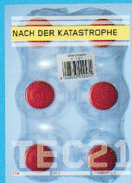
Tec21 n.8 NACH DER KATASTROPHE www.tec21.ch