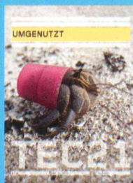
Tec21 n. 31-32 Umgenuzt www.tec21.ch