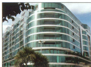
Palazzo Mantegazza: architettura futuristica in un luogo d'eccezione a Lugano-Paradiso

Per maggiore informazione si possono consultare i siti www.corradi.eu e www.rezz.ch .