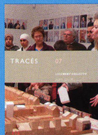
Tracés n.07 Logement collectif www.revue-traces.ch