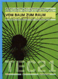
Tec21 n.07 Vom Baum zum Raum www.tec21.ch