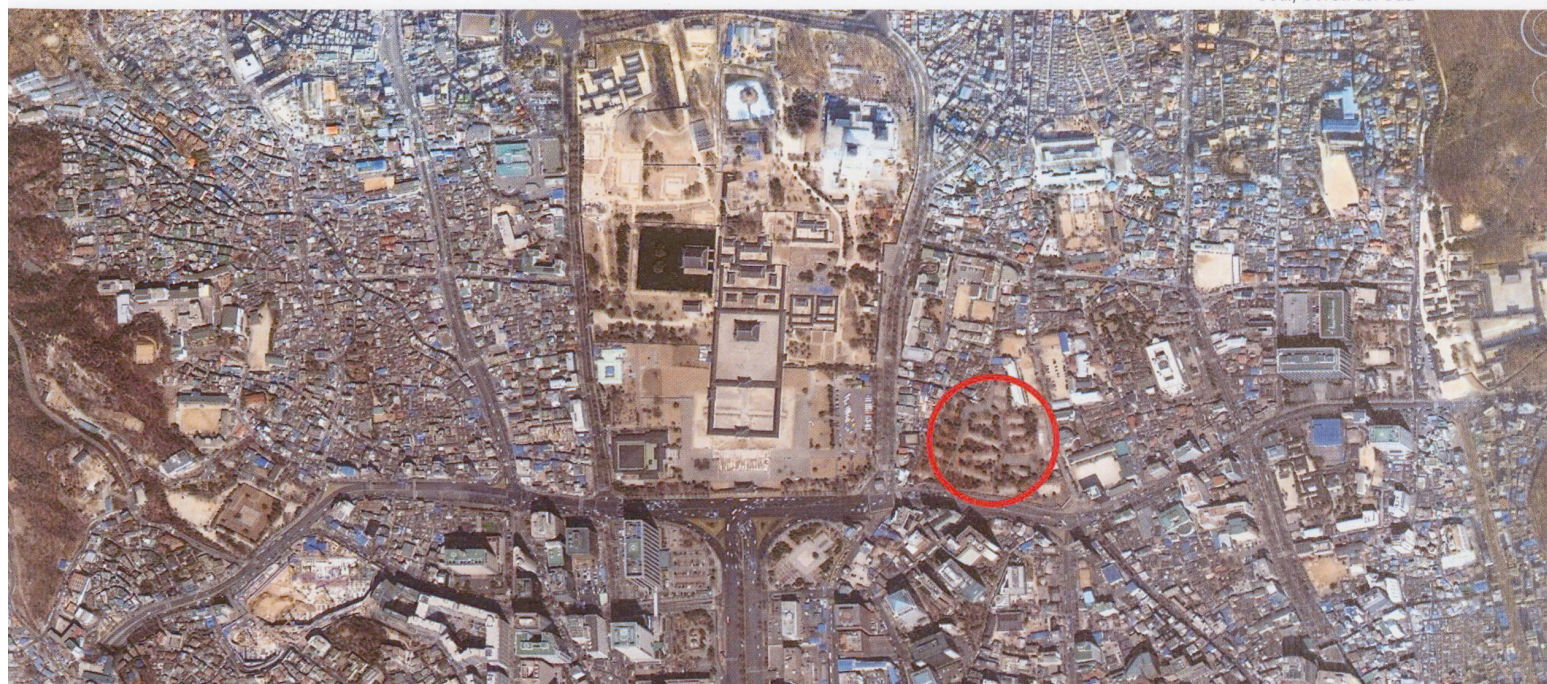
Area Songhyun-dong Seul, Corea del Sud

Se la torre Kyobo si colloca in un tessuto urbano senza una specifica identità, casuale, il museo Bechtler si trova in Charlotte, una città di fondazione. La sua storia inizia nel 1768 con un insediamento a scacchiera, regolato da due assi, un cardo e un decumano. Il suo impianto è ancora oggi di natura razionale con una matrice illuministica che si ritrova in alcune sue architetture caratterizzate da un linguaggio neoclassico. Oggi è in una fase di grande sviluppo, con un suo riconoscibile