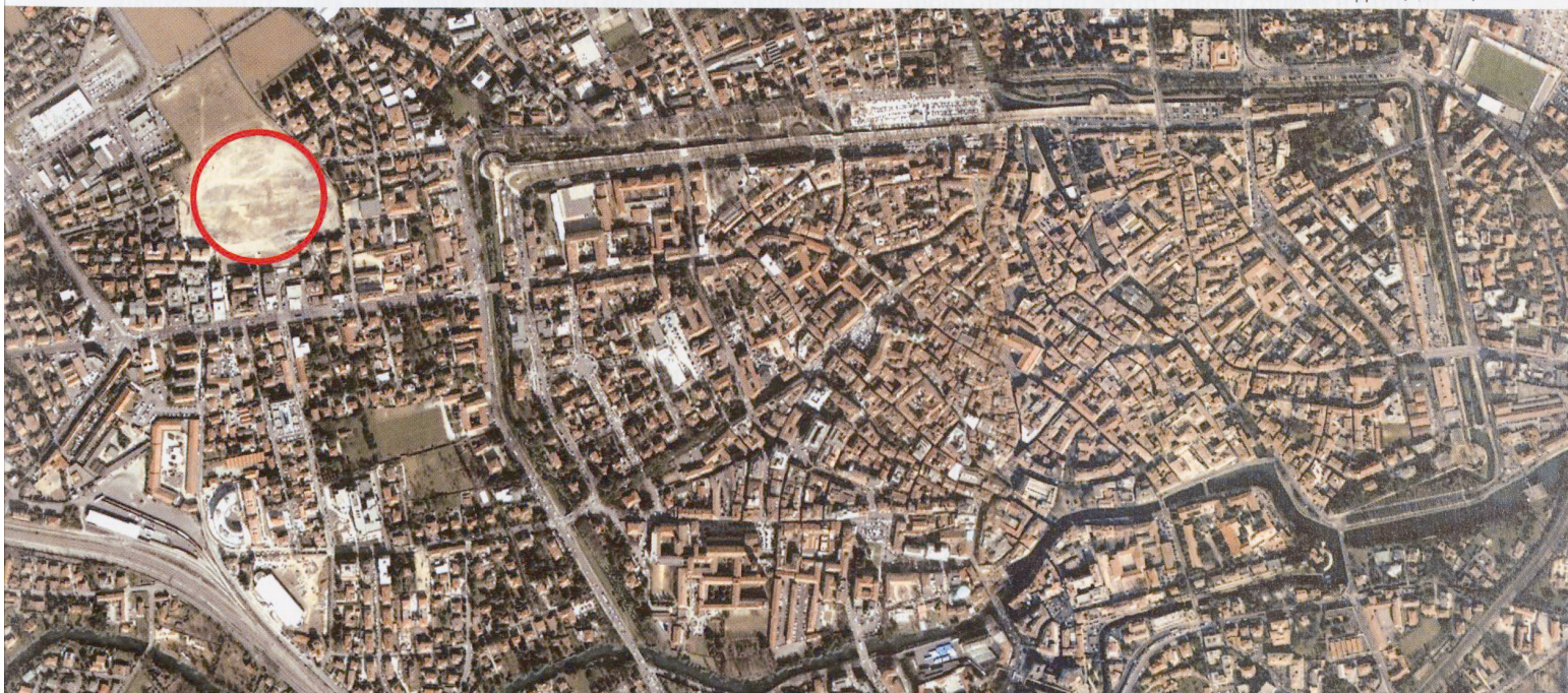
Area ex-Appiani, Treviso, Italia

Il caso Treviso è un sintomo per comprendere cosa sta accadendo e può continuamente accadere nell'Europa delle piccole città: i luoghi di rappresentazione civica, meno le chiese, sono destinati a trovare altri luoghi, altri spazi, forse, ma non sempre, altre piazze. La causa è la difficile mobilità e l'insufficienza dei parcheggi nei centri storici, ma è anche il fatto che il nostro modo di costruire la nostra identità e la nostra capacità di convivenza non ha più bisogno di rappresentarsi attraverso architetture capaci di evocare i poteri, di rappresentarli. Quelle architetture che affacciandosi