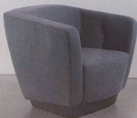
Rivo. Design Hannes Wettstein.