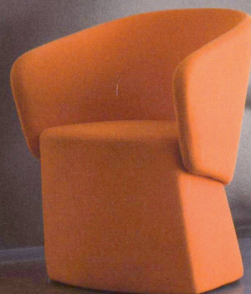
Tulo. Design Shin Azumi.