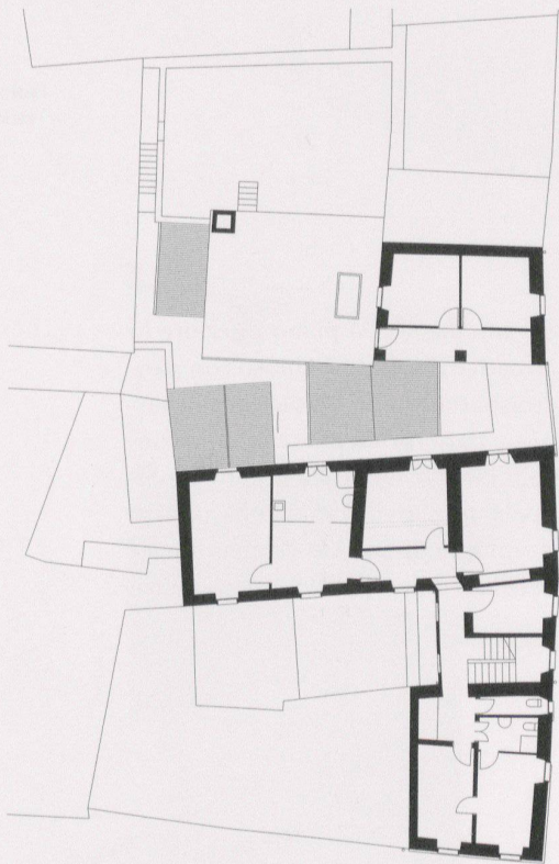
Pianta primo piano prima e dopo l'intervento