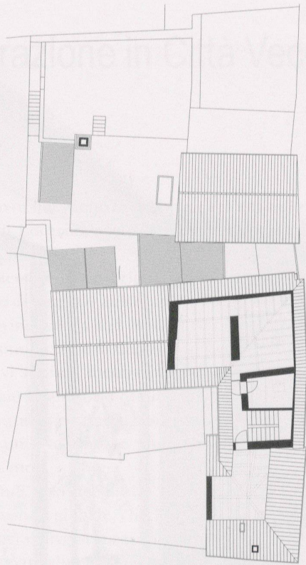
Pianta piana mansarda prima e dopo l'intervento