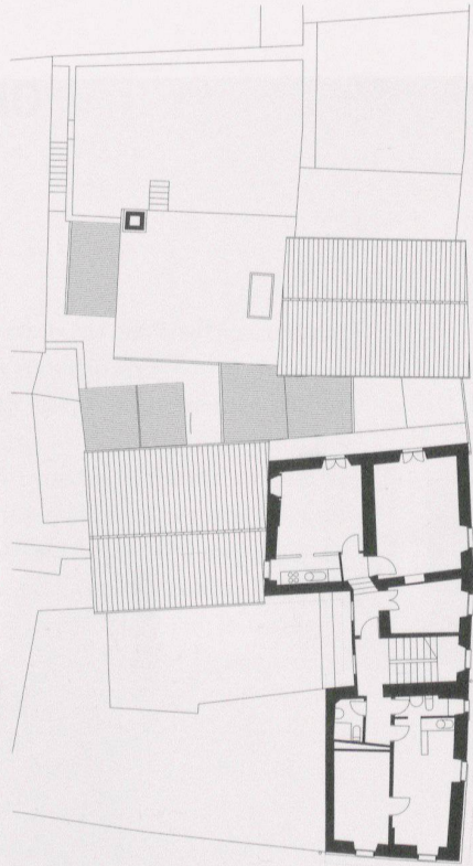
Pianta secondo piano prima e dopo l'intervento