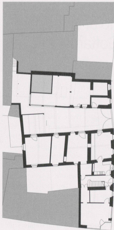
Pianta piano terra prima e dopo l'intervento