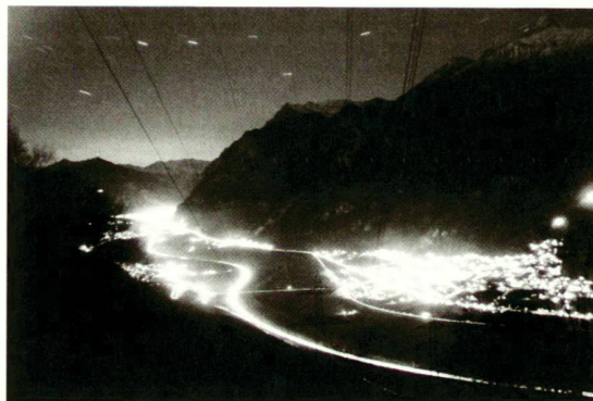
Paesaggio luminoso della Riviera